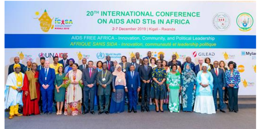
PHOTO DE GROUPE DE DIGNITAIRES A LA CEREMONIE D'OUVERTURE DE ICASA 2019

Banque : ECOBANK GHANA LIMITED Succursale: A&C SHOPPING MALL, EAST LEGON Adresse: PMBGPO ACCRA – GHANA Nom du Compte: SOCIETY FOR AIDS IN AFRICA-ICASA 2021 PARTNERSHIP/SATELLITE/EXHIBITION Numéro de Compte: 2441000304906 Code Swift de Ecobank: ECOCGHAC Banque Correspondante de Ecobank: DZ BANK, FRANKFURT GERMANY Code Swift pour la Banque Correspondante: GENODEFF Devise Du Compte : US Dollars Référence : Le but du transfert doit être indique dans le champ de référence Côte de la banque : 13-01-00 Côte de la branche : 13-01-07 NB : (i) Toutes les charges locales et extérieures doivent être prises en charge par l'émetteur (ii) Veuillez toujours nous envoyer la preuve de transfert ou le Swift pour notification/suivi et sauvegarde. Merci.