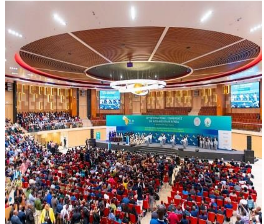
CEREMONIE D'OUVERTURE DE ICASA 2019

Veuillez consulter les pages suivantes pour les renseignements sur chaque article.