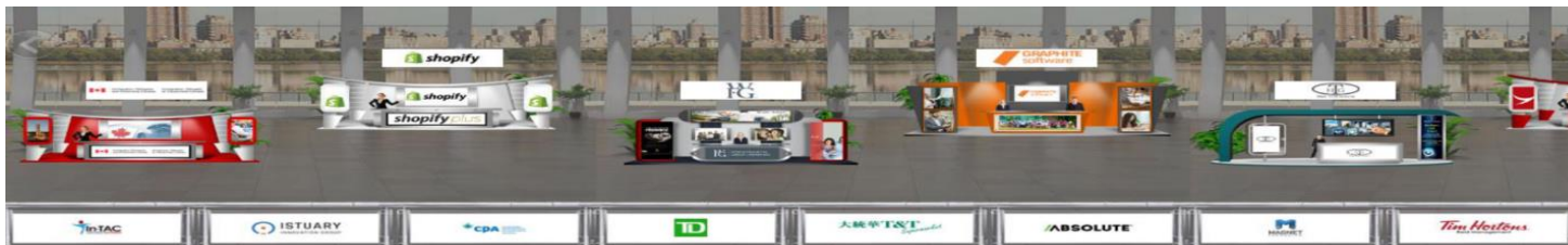
Hall d'exposition virtuel