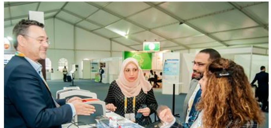
Exposition à ICASA Rwanda