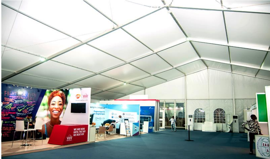
Hall d'exposition en présentiel de ICASA 2019