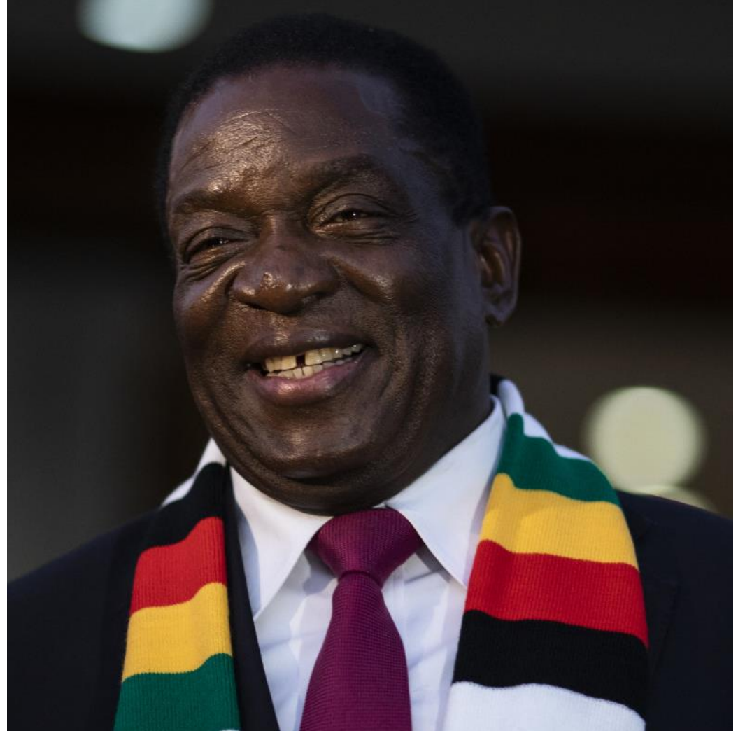
H.E. Emmerson Dambudzo Mnangagwa, Le président du Zimbabwe