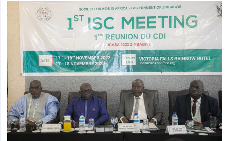
PRESS CONFERENCE AT VICTORIA WATER FALLS

Réservez votre espace d'exposition hybride maintenant – DATE LIMITE: 31 AOUT 2023